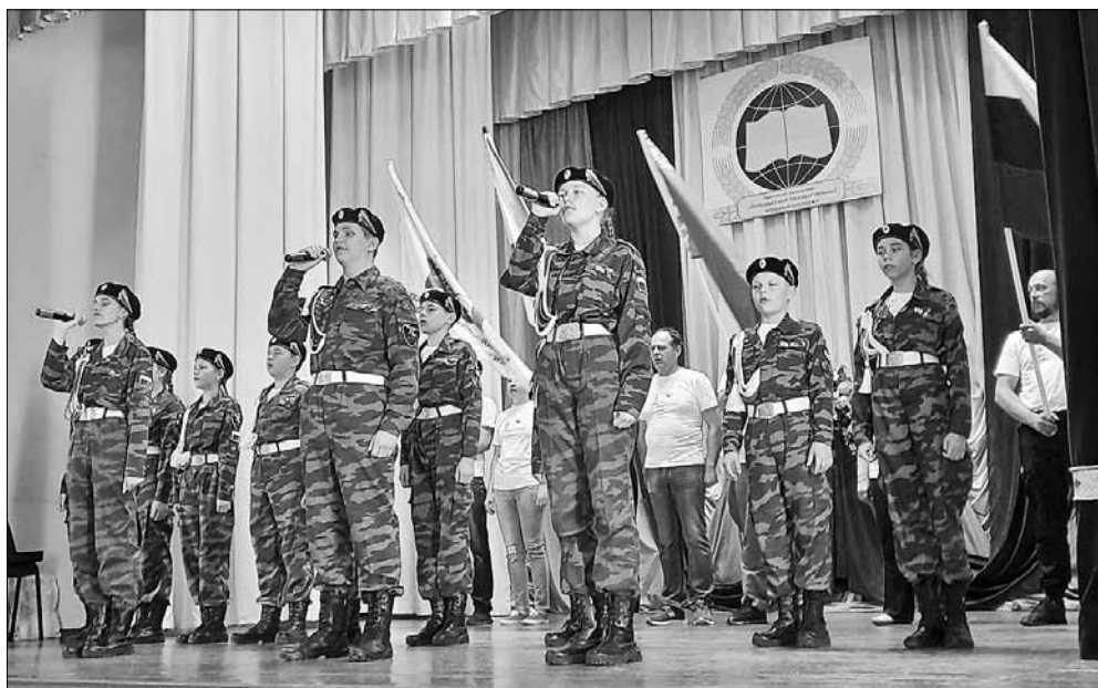
■ Курсанты поискового центра выступили с программой «Нам память досталась в наследство» перед жителями города Волковыска

Посетили мемориальный комплекс «Рыленки», воздвигнутый в 1973 году на Рыльском братском кладбище в Дубровенском районе Витебской области.