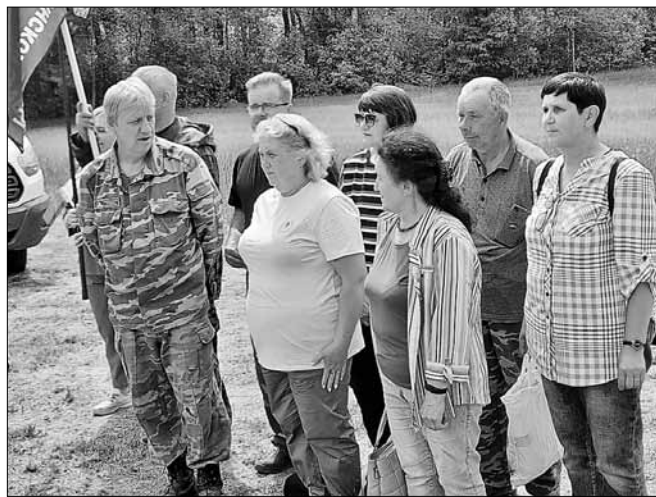
■ У мемориала на доте 43 в деревне Матейково Полоцкого района Витебской области состоялся марш Памяти