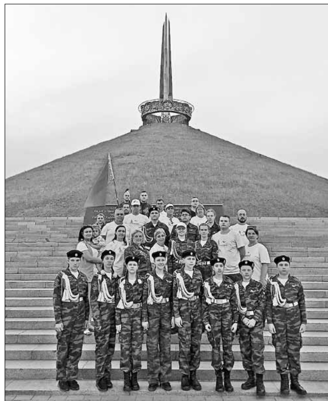
■ Курсанты возложили венки к Вечному огню на Кургане Славы и преклонили колено, чтобы почтить память павших

Кроме того, руководитель АРУИЦ поблагодарила белорусских школьников, активно участвующих в поисковой работе, и вручила им сертификат на участие в палаточном лагере «Нам память досталась в наследство». Так что палаточный лагерь центра смело можно будет называть международным.