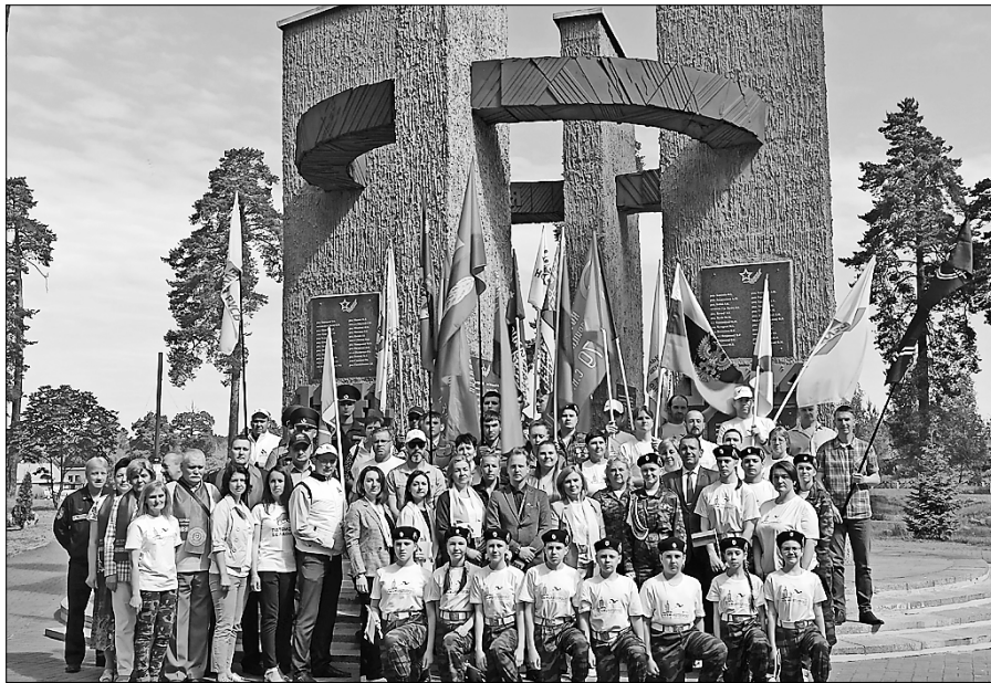
■ Мемориальный комплекс «Звезда» в Боровухе

В годы Великой Отечественной войны здесь был поселок, где размещался