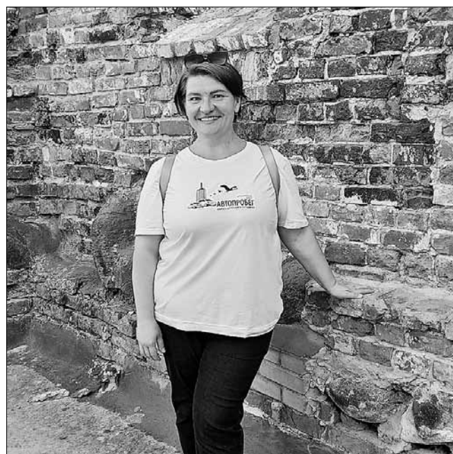
■ Материалы подготовлены на основе дневниковых записей Светланы Козиной, фото: страница в соцсети «ВКонтакте» «Архангельский региональный учебный поисковый центр»

На торжественном митинге у памятника киргизу Джумашу Асаналиеву собрались российские и белорусские школьники.