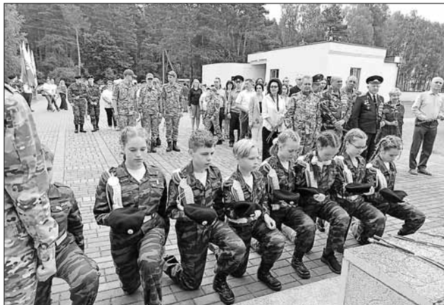
■ Урочище Пороховня, где состоялся митинг с участием руководства Волковысского района