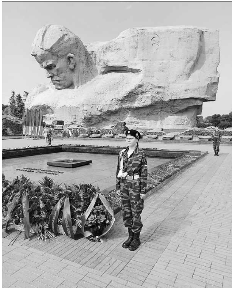
■ В 4 часа утра в Брестской крепости тысячи людей отдали дань уважения защитникам крепости и всем погибшим за Родину минутой молчания, к Вечному огню возложили цветы