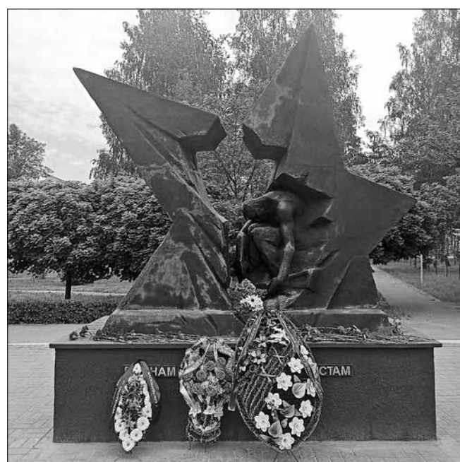
■ Памятник воинам-интернационалистам «Расколота звезда». Он представляет собой бронзовую звезду. В ее разломе склонился к колену уставший безымянный солдат

Участники автопробега приехали в мемориальный