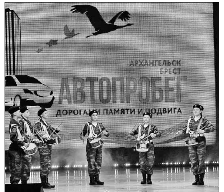
■ Ребята из Архангельского учебного поискового центра порадовали своих коллег из Новополоцка замечательной концертной программой