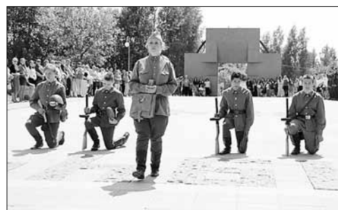
■ Автопробег пролег через Городокскую землю