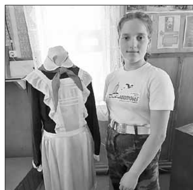
■ Курсанты посетили Александрию, увидели школу, где учился будущий президент Беларуси, и даже посидели за его партией